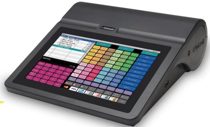
Ecran large haute définition

Fonctionnalités de gestion et de reporting des ventes basées sur le terminal ou le cloud disponibles via les logiciels de back-office.